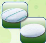
德湿威24™ TenderWet24® 德湿威™ TenderWet®